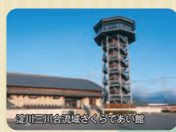
淀川三川合流域さくらであい館

〈淀川河川公園 さくらであい館〉 ●八幡市八幡在応寺地先 ●TEL 075-633-5120