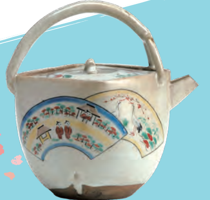
大和画酒瓶 奥田木白 個人蔵