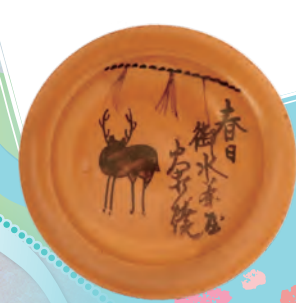
春日御水茶屋火打焼皿 奥田木白 個人蔵