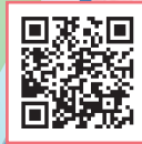
背割堤さくらまつり