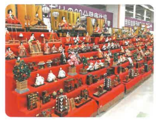
メイン会場(ファミレやわた3階) 大きな段飾りがずらりと並ぶ様子は圧巻です！ 各会場の個性豊かなお雛さんもお楽しみに