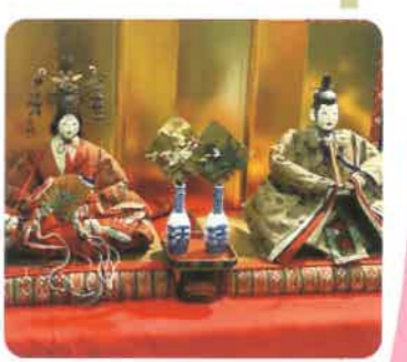
山柴公民館 山柴公民館で大正・明治のお雛さんを初めて展示します！