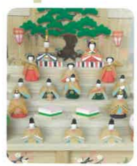
ピタットハウス 立派な一刀彫りのお雛さん