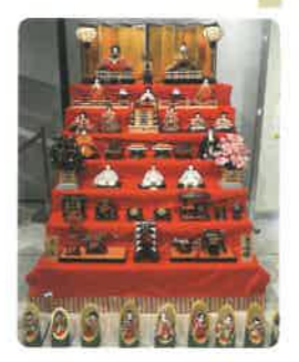
八幡市役所 今年も八幡市役所にお雛さんが登場します 展示期間 2月13日(木)~3月3日(月) 8:30~17:00 ※土日祝日は閉庁のため観覧不可